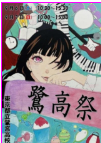
今年のパンフレット表紙

なお、今年の鷺高祭では正門前の受付での紙パンフレットの配布は無くなり、代わりに2次元コードをスマホで読み取って入場者各自がスマホ上で閲覧する方法になりました。