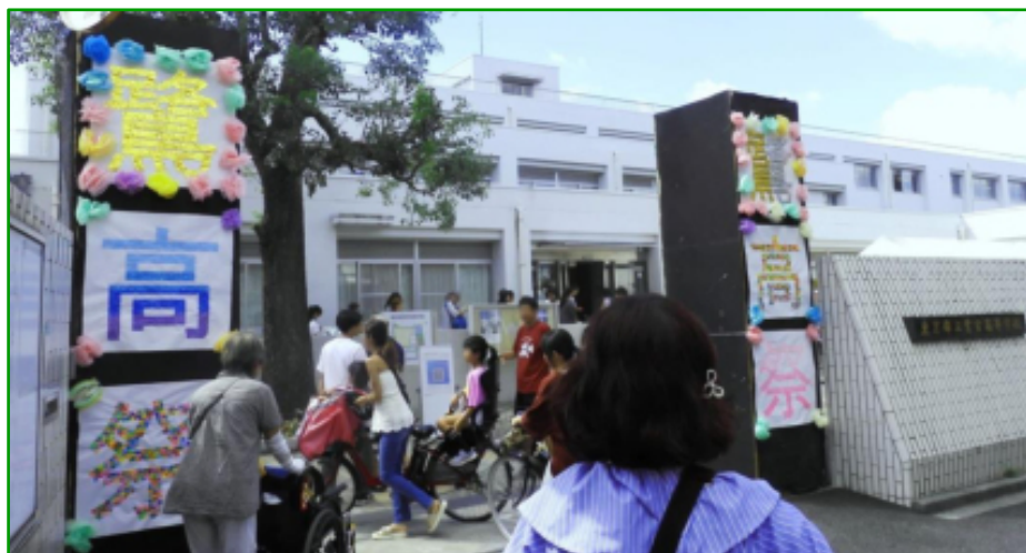
2日目の開場直後の正門前 (9月7日)