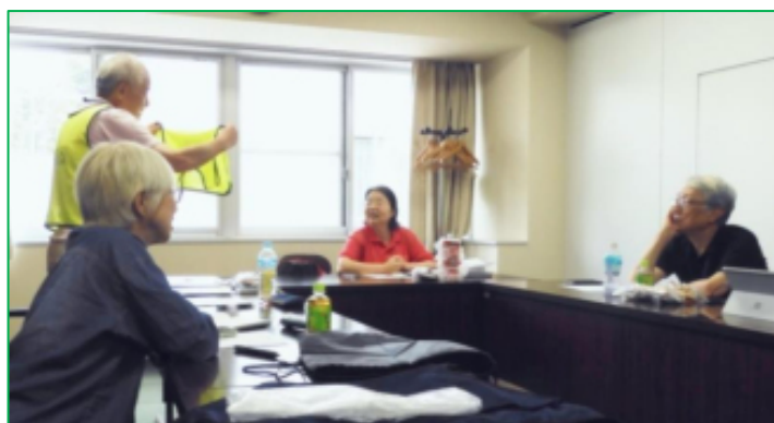
役員会でのビブス制作の検討 (7月5日)

役員や同窓生が校内で緑化支援活動に携わる際、在校生や教職員の方に紫明会の会員(同窓生)であることをアピールする為に、ネーム入りのビブス(ベスト状のユニフォーム)を制作しました。