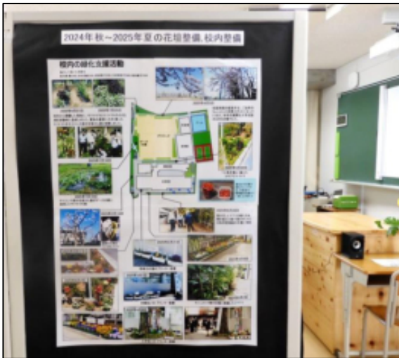
緑化支援した校内地図 (A1サイズ) の展示