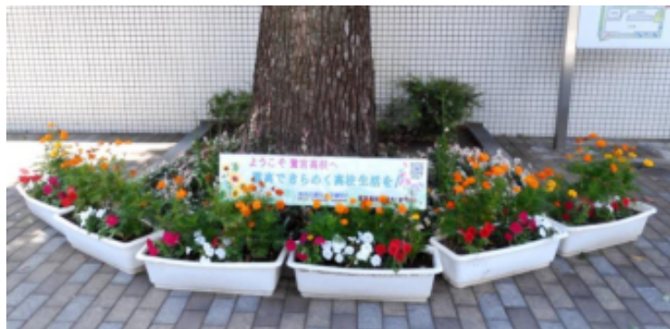
正門前の楠木の下に設置したプランター群 (7月31日)