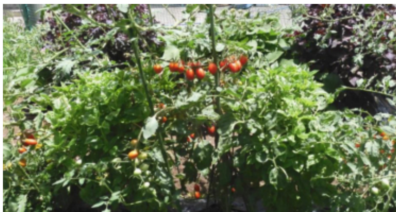
裏門近くに造成した畑に植えたミニトマト群(7月18日)