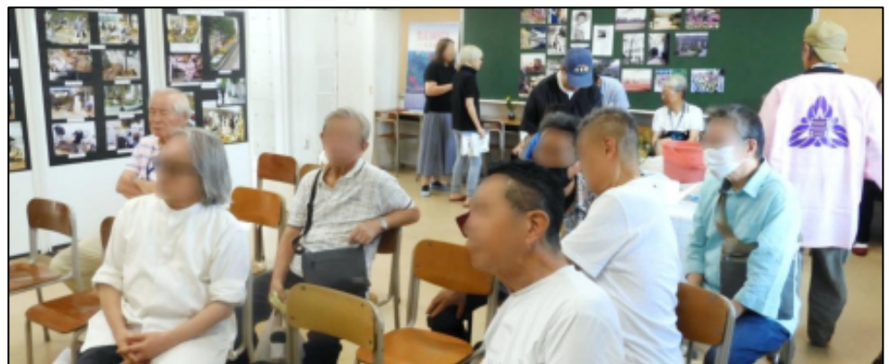
上映動画を興味深く観て頂きました